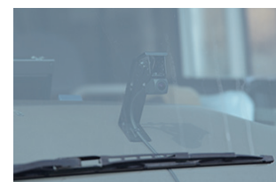
ドライブレコーダー