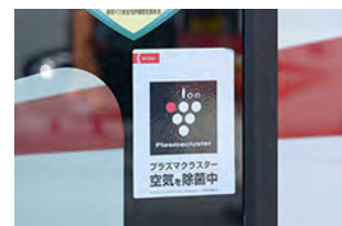
プラズマクラスター搭載